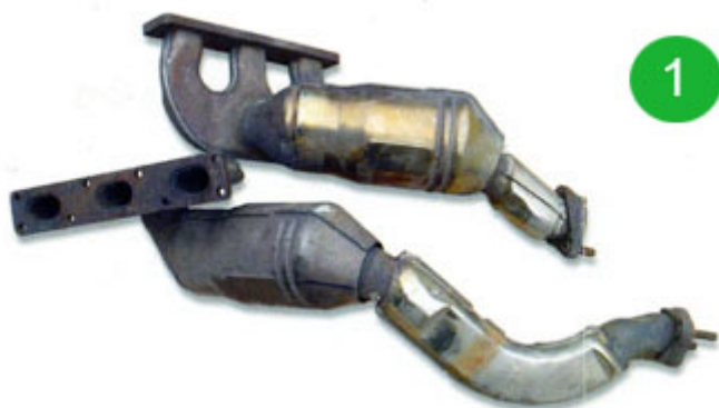
Katalizator pred obnovo npr. (BMW 320 '00-)

Predstavljamo vam 6 točk obnove katalizatorja.